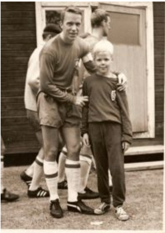
Förebilden Agne Simonsson

I min förra text resonerade jag kring varför jag tycker att vägen framåt för ÖIS är att återerövra idrottsrörelsens gamla ideal och sätta dem som ledstjärna för verksamheten, och hur detta skulle kunna yttra sig i klubbens allmänna agerande. Nu är det så dags att titta på om det nya sättet att tänka också lämnar avtryck på planen.