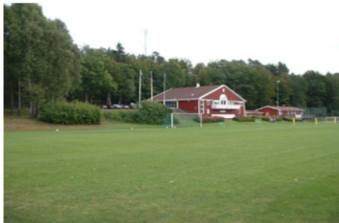
Quo vadis, ÖIS?

Och det är här jag kommer till den dystra delen av texten. Slutsatsen av allt mitt funderande är att det, åtminstone för tillfället, inte finns någon djupare mening med ÖIS. Det är inte speciellt givande eller meningsfullt att engagera sig i Sällskapet, för man får väldigt lite tillbaka. Man bidrar inte till att göra världen bättre, och man har inte speciellt roligt heller. Det finns inget som skiljer ÖIS från